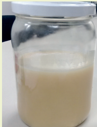
Figura 2. Sòlid recuperat després de la hidrogenació.